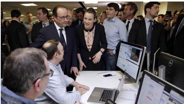
François Hollande en compagnie de la secrétaire d'Etat chargée du Numérique, Axelle Lemaire, le 10 mars 2015